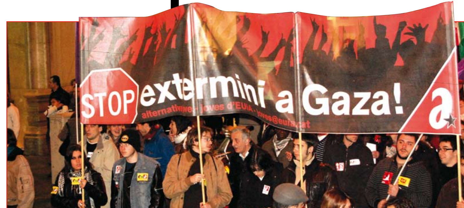
El passat 10 de gener, milers de persones ens vam manifestar a Barcelona per a denunciar la massacre a Gaza.

D urant poc més de tres setmanes Israel ha dut a terme una massacre a la Franja de Gaza, que ha deixat un recompte de més de 1.300 morts (molts d'ells infants) i més de 5.500 ferits.